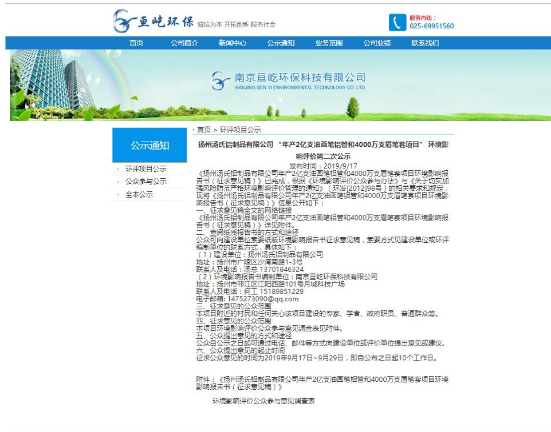
图 3-1 征求意见稿网络公示截图

根据《环境影响评价公众参与办法》（生态环境部令 第4号）中相关要求，扬州汤氏在南京亘屹公司网站（ http://www.njgenyi.com/tongzhishow.asp?id=40 ）进行了环境影响评价第二次公示，第二次公示截图详见图 3-1。