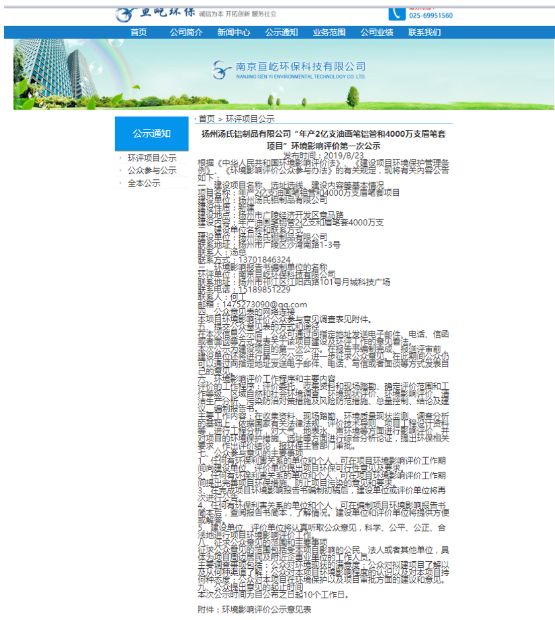
图 2-1 环境影响评价首次公示网页截图